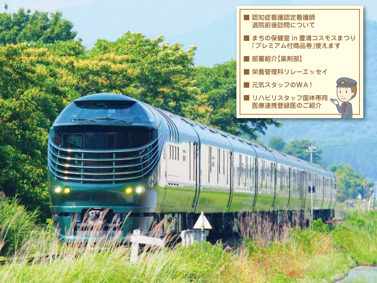
「豊浦の町を駆けるトワイライトエクスプレス瑞風」 (第10回豊浦フォトコンテスト応募作品)