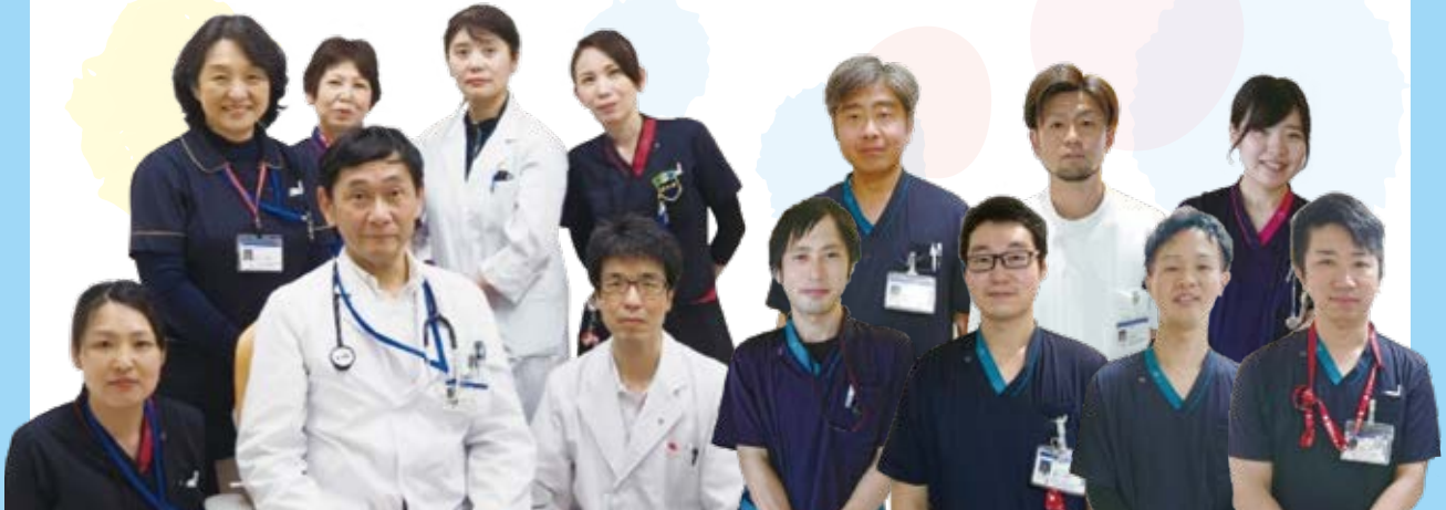
豊浦病院糖尿病教室スタッフ一同

食事・運動・お薬など聞きたいことやご相談があれば、ご遠慮なくスタッフへ声をかけていただければと思います。 また、待ち時間に日常生活のワンポイントなど映像で流しておりますので、ご覧いただければ幸いです。