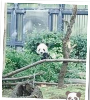
上野動物園 シャンシャン (3歳♀)

私が看護師を目指した理由は日本に来てすぐ体調を崩し、言葉もわからない私に「笑顔と希望」をくれた白衣の看護師さんと出会えたからです。彼女は全く困った顔をせず、優しい表情ですと私に話しか