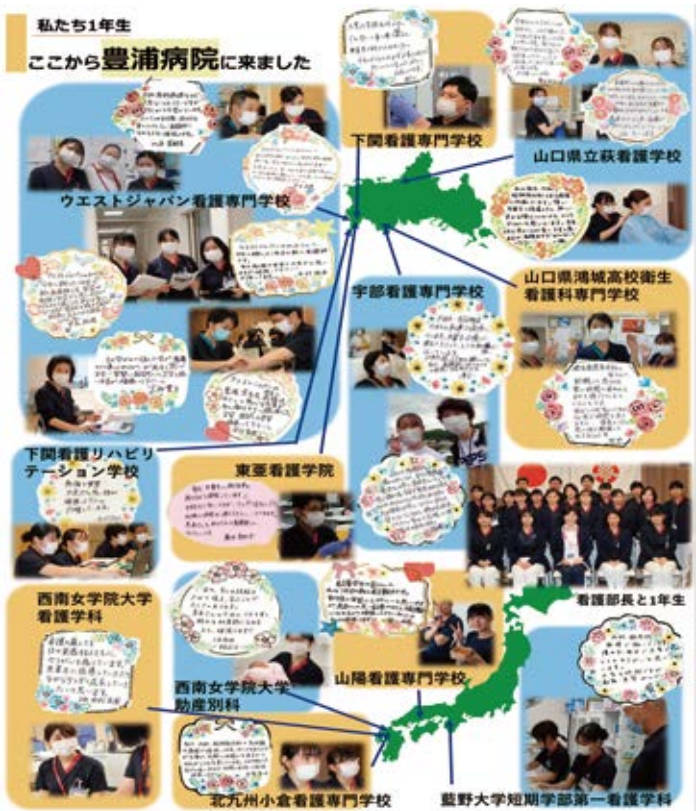
(実際の手作り新聞_裏面)

医療従事者の中でも、看護師は特に人手が深刻化していると言われていひます。超高齢社会に突入している日本において、看護師の需要の増大は避けて通ることができません。さらなる看護師不足が予測される中、これまで通り安全な医療、看護を提供していくためには人材確保の活動が必要になります。当院も、人材確保に積極的に取り組み、人材育成に力を入れ、より質の高い看護の提供を目指してひます。