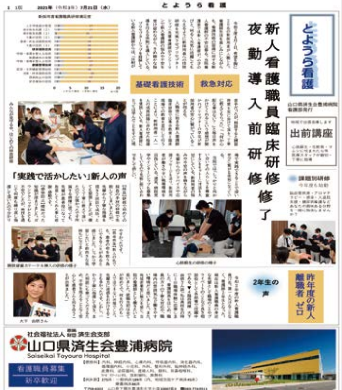
(実際の手作り新聞_表面)

今年度4月、当院看護部には20名の新人看護職員が就職しました。新人は実践力を高めるため、日々同期の仲間達と切磋琢磨し新人研修や臨床現場の看護実践に臨んでいます。そこで、新人看護職員の母校に向けた新聞を発行しました。卒業した看護学校の後輩達へ伝えたいと思い、オリジナルの新聞を作成し母校へ届けました。後輩である看護学生達は先輩の頑張っている姿に刺激を受け、豊浦病院の職場環境に興味を持っていただけたようです。新人看護師はプレッシャーも大きく、時には精神面へのサポートも必要になります。当院はプリセプターシップを導入しており(先輩と後輩がマンツーマンで指導)、いつでも先輩に相談できる体制を充実させています。今後も、卒業生の現場での活躍や、看護の魅力を広報活動を通じて看護学生に伝え、新人看護職員が安心して就職できるように活動していきたいと思ひます。