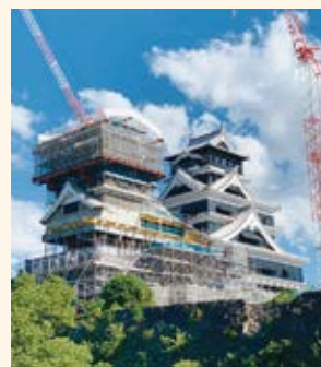
復旧工事中の熊本城