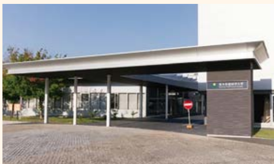
熊本保健科学大学

師教育課程で、6カ月間学んできました。慣れない環境に馴染むことも大変でしたが、レポートやプレゼンテーションの準備・資格取得に向けての学習など毎日が追われる日々でした。実習では、認知症の人は自らの思いを伝えることが難しいため、それを引き出すためには、表情や言動を観察し、分析を繰り返し紐解いていくことで、認知症の人の思いを引き出すことができるということを学びました。また、教育課程修了後から認定審査までの期間がCOVID-19の影響で延期となり、モチベーションの維持や仕事と試験勉強の両立に悩みました。同じ目標を持った同期生25名と家族や友人、病院スタッフの支えや励ましが私にとって大きな力になり、無事に資格を取得することができました。