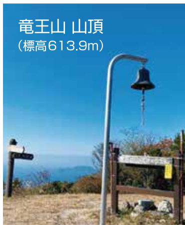
竜王山 山頂 (標高613.9m)

なかでも、登山へはよく行くようになりました。下関は標高600メートル程度の山が多く、初心者でも気軽に登れる山が多いです。よく登る山としては、竜王山、狗留孫山があります。竜王山は数コー