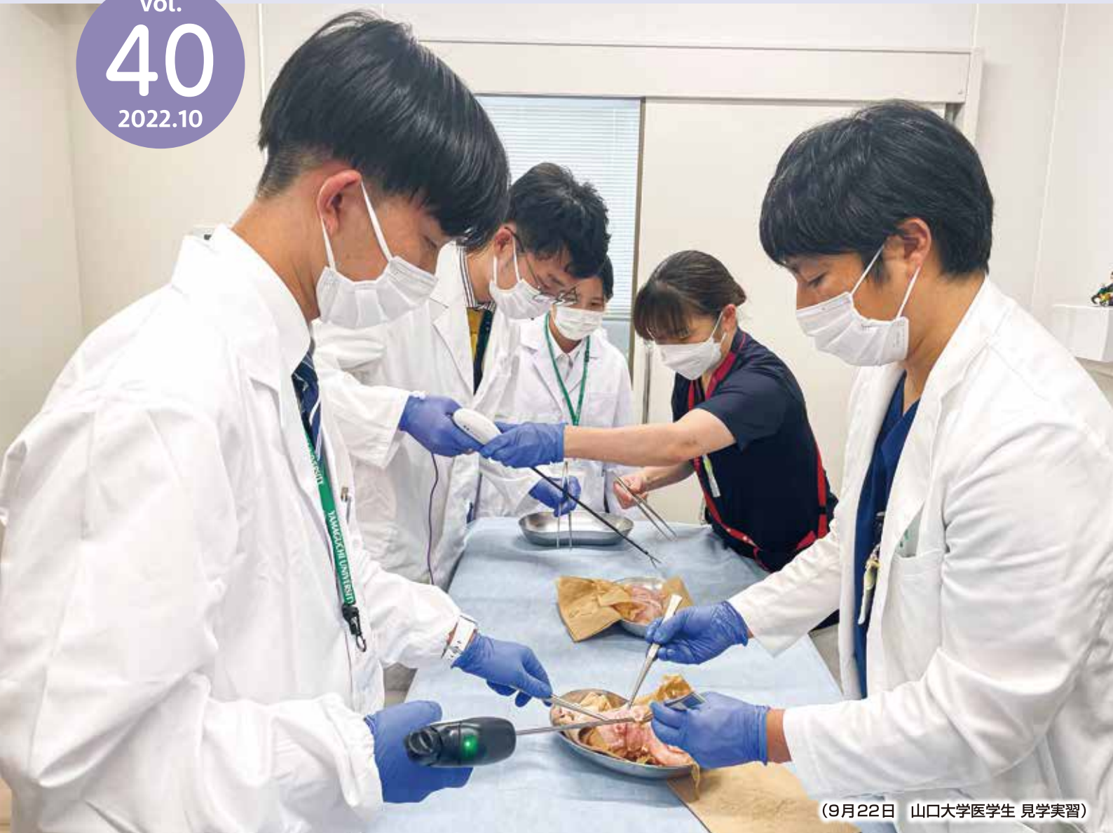
(9月22日 山口大学医学生 見学実習)