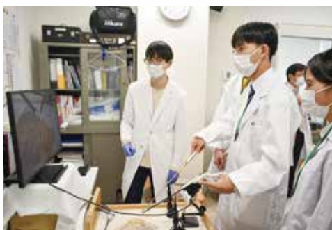
腹腔鏡手術シミュレーション