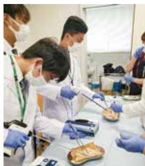
超音波凝固切開装置と 鶏肉を使った手術体験