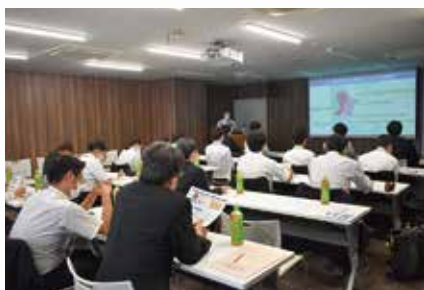
院長より地域医療について説明