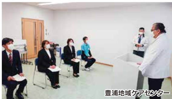
豊浦地域ケアセンター

新入職員はオリエンテーションに参加後、各部署に配属され新たなスタートを切ります。これから共に豊浦病院・豊浦地域ケアセンターを盛り上げる仲間となることを期待しています。