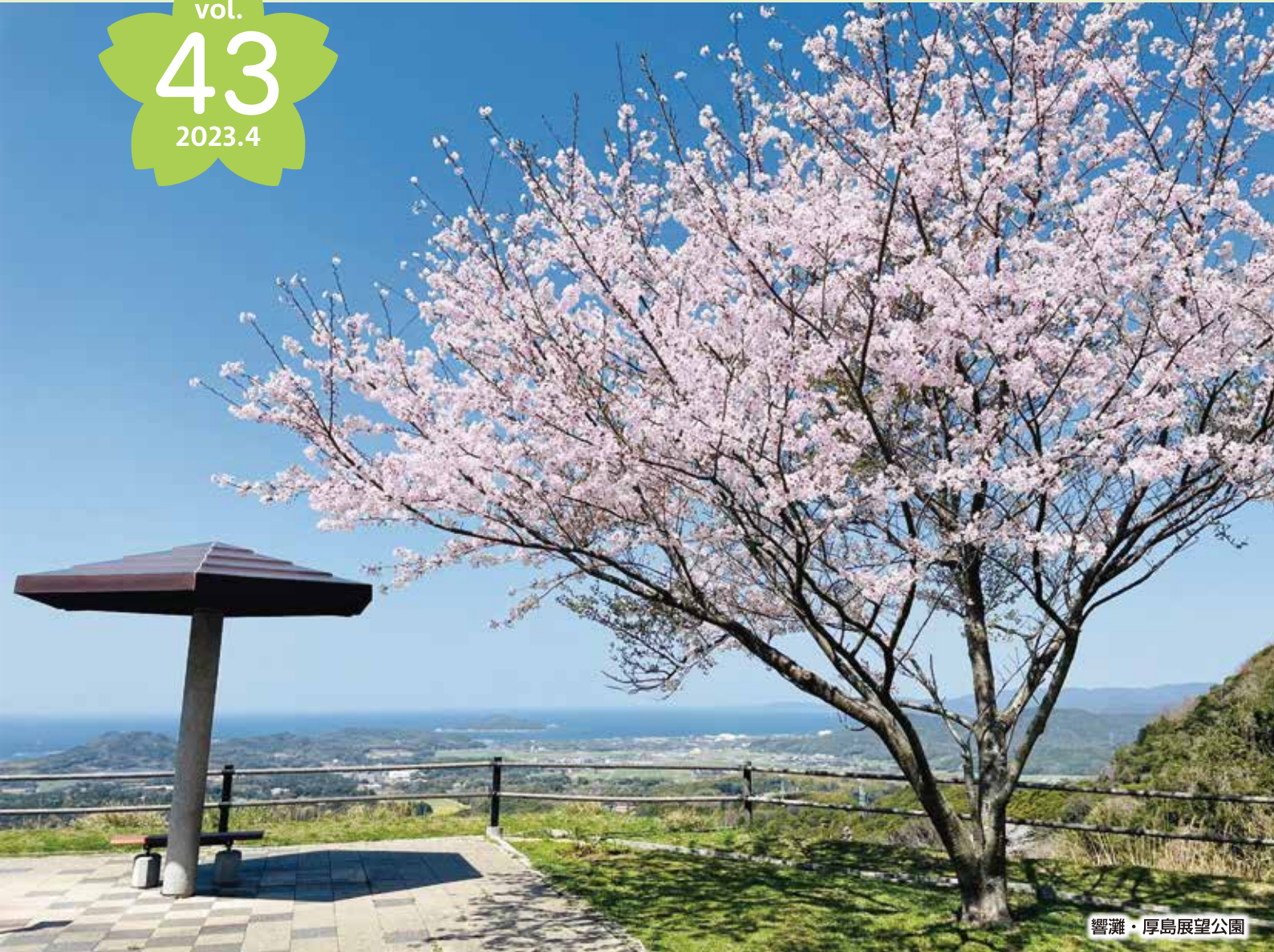
響灘・厚島展望公園