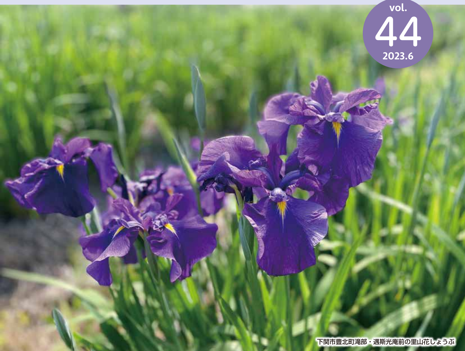
下関市豊北町滝部・遇斯光庵前の里山花しょうぶ